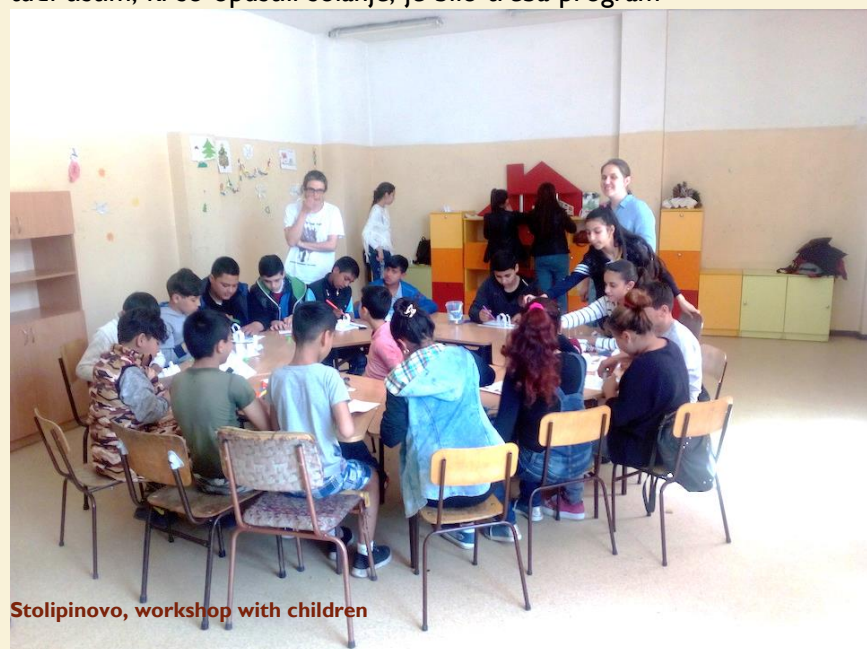
Stolipinovo, workshop with children

Da bi izboljšali povezavo med šolo in sosesko, otroke vrnili k pouku in jim ponudili alternativo statičnim teoretičnim dejavnostim v razredu, so v projekt vključene šole kot pomembna postaja na poti mobilne šole. V zimskem času se bo avtobus ustavljal na šolskem dvorišču, pouk pa bo potekal v ločenem prostoru v šoli "Dimcho Debelyanov", ki ga bo združenje "TRANSFORMERS" skupaj z otroki spremenilo v ustvarjalni prostor. Lokalne državljanke bo vključil v delo partnerstva za vključitev prednostnih nalog in potreb skupnosti ter razširjal najboljše prakse in znanje bodočim trenerjem iz skupnosti. Z doseganjem skupnosti na ta način (pred in med pandemijo) so najbolj ranljivi otroci v regiji Plovdiv lahko pridobili dostop do izobraževanja, kar prispeva k izboljšanju kakovosti njihovega življenja.