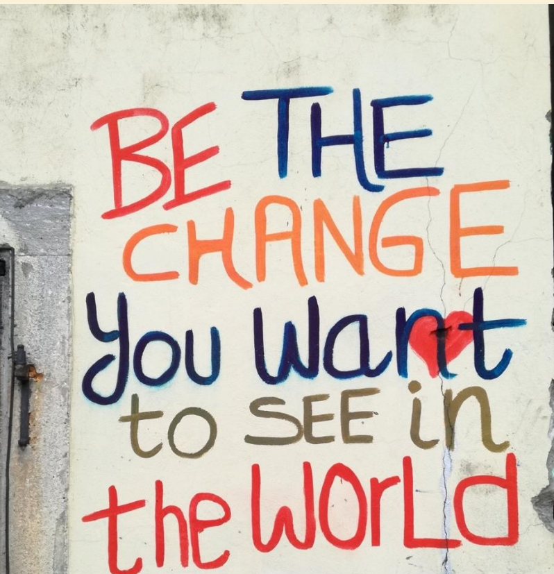
Graffiti on the wall, Petrinja

Eden glavnih obstoječih ukrepov, ki se je izkazal za najbolj uporabnega, je bila mentorska podpora. Prostovoljci so povedali, da so jim mentorji zelo pomagali pri prilagajanju na nove razmere. Drugi pomemben element, ki ga Mladinska mreža poudarja, je pomen medsebojne solidarnosti.