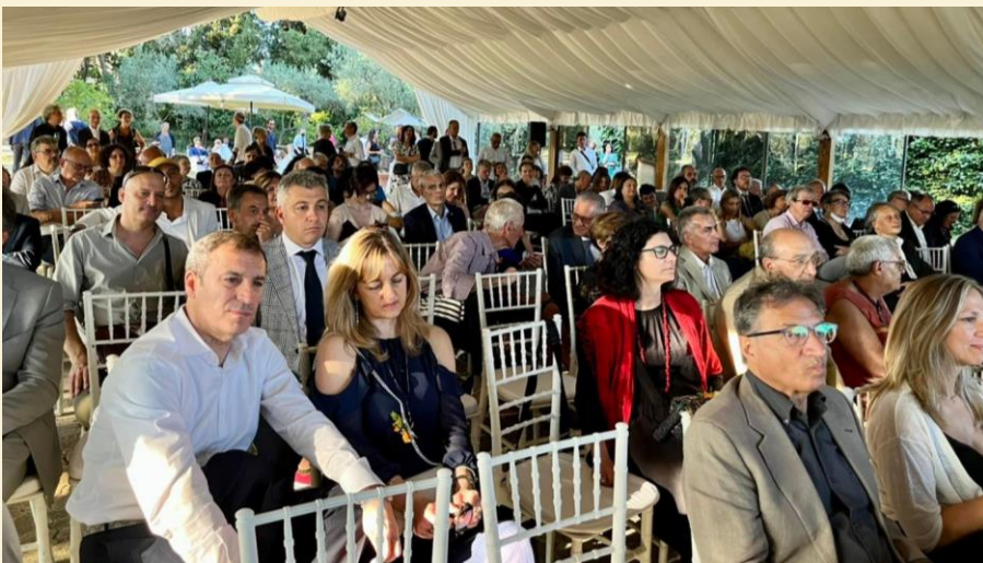
Training workshop on inclusive education for migrants and refugees

ASSOCIAÇÃO , iz Avstrije INTERAKTION - Verein für ein interkulturelles