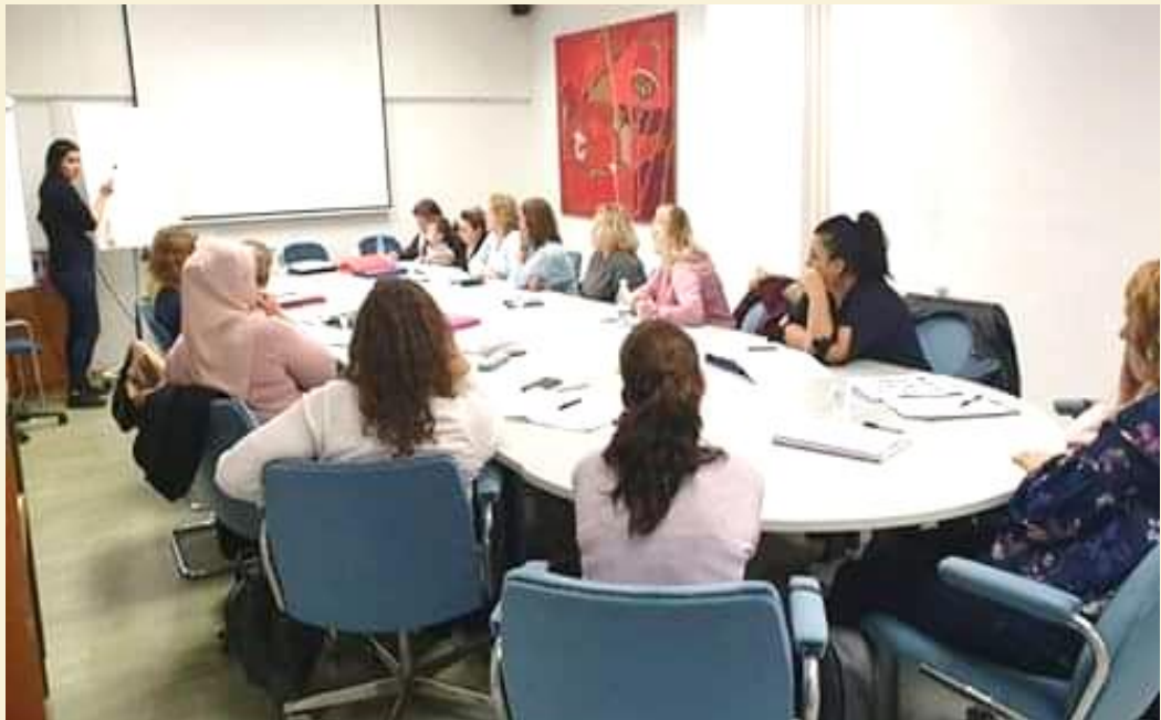
Training: active and non-judgmental listening skills

at the end of the project more than 120 adult educators acquired skills and knowledge about volunteer coaching. Specifically, the participants have gained skills allowing them to work with less-qualified adults, (i.e. know-how on how to conduct tutoring and applying