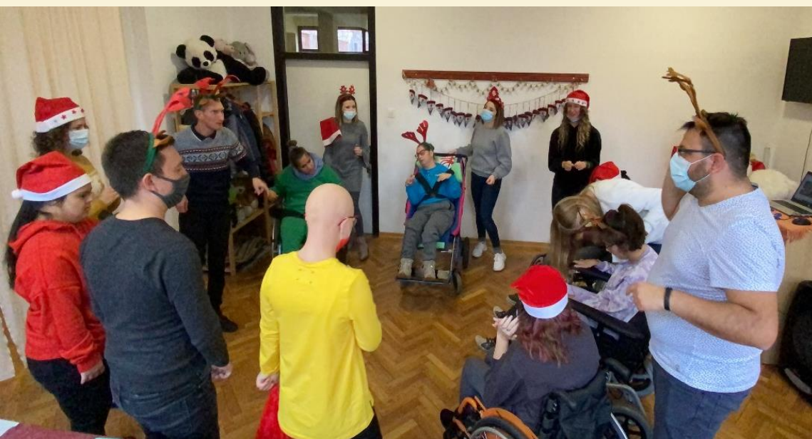
Volunteers and users of the association I am with you

druge neprofitne organizacije v Varaždinu. Z namenom obeležitve Svetovnega dneva dobrih del in pridobivanja novih prostovoljcev je društvo organiziralo dogodek ŠPANCIRAJ SA MNOM VARAŽDINOM. Novi prostovoljci so imeli priložnost spoznati društvo in uporabnike ter kako z njimi sodelovati na dogodku. Uz tebe sam je s sprehodom po Varaždinu in primerno vadbo na mestnih trgih prispeval k izboljšanju duševnega zdravja skupnosti.