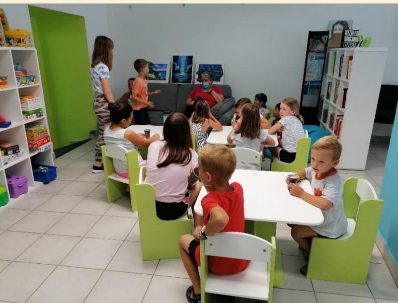
Špajza modrosti, workshop with children

ROTARACT KLUB PTUJ IN LEO KLUB PTUJ sta drugi organizaciji, ki temeljita na prostovoljstvu in delata spremembe. So humanitarne organizacije za mlade od 18 do 30 let. Za včlanitev ni ovir. Mladi lahko pridobijo izkušnje na področju vodenja, nova organizacijska znanja in spoznajo finančno upravljanje. Mreženje z drugimi mladimi. zelo pomembna vidika članstva v klubih so tudi mladi in druženje. Klubi nenehno iščejo nove člane. Ena ključnih prostovoljskih akcij, ki jih klubi vsako leto izvedejo, je KOSTANJEV PIKNIK, ki je enodnevni dogodek, ki poteka vsako leto v oktobru.